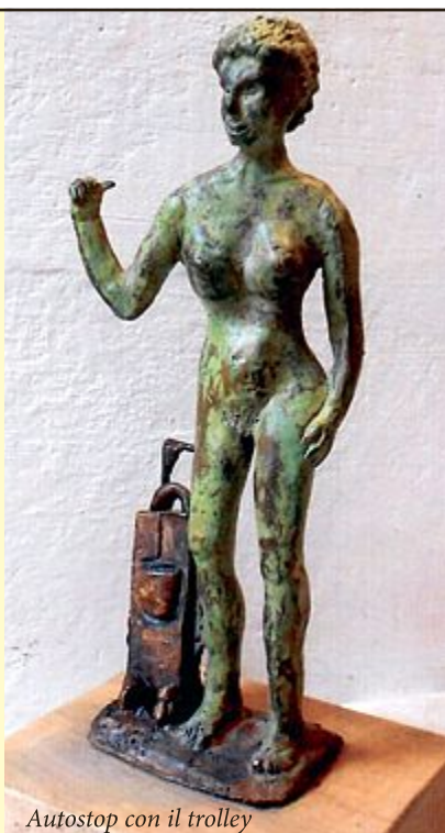
Autostop con il trolley

alla Galleria d'Arte "Pontevecchio" Via Borgo San Jacopo, 46r Firenze